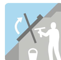
Schéma střešních oken GPL a GPU najdete na str. 21.